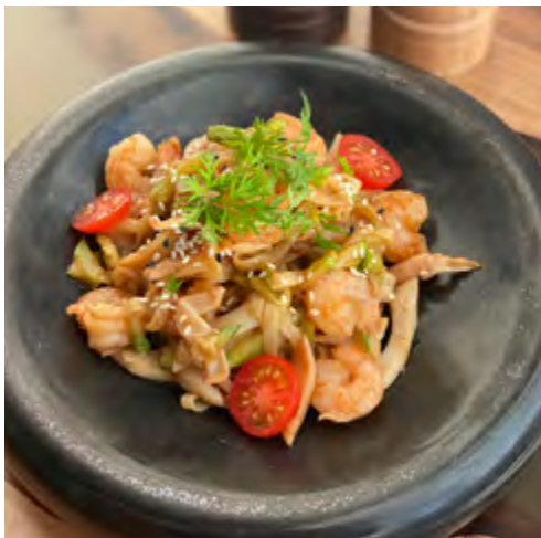
Удон с креветками и кальмаром под соусом унаги