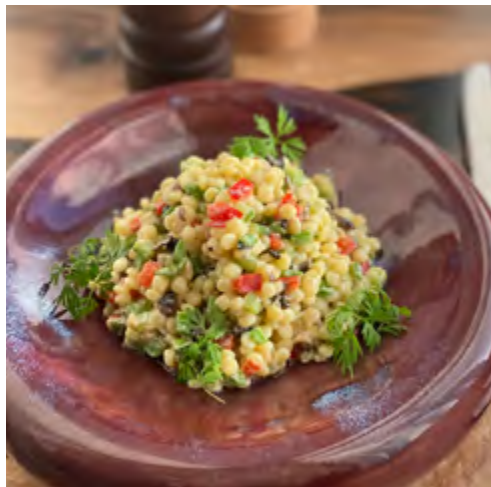
Птитим с овощами под сливочным соусом