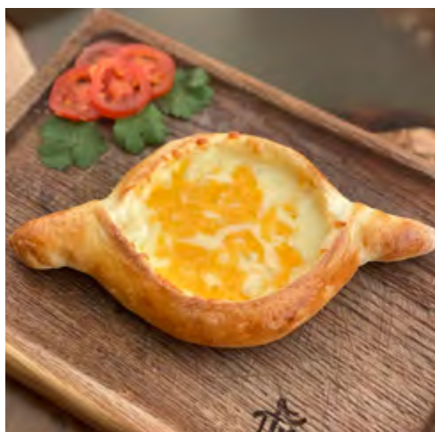
Хачапуре 3 сыра