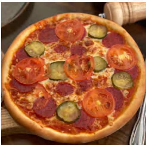
Пицца с саями