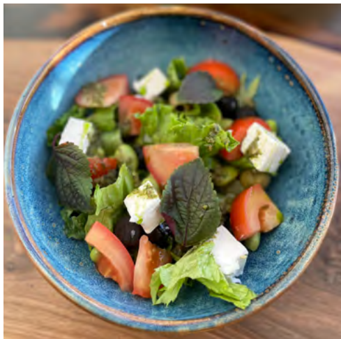
С оливками, бобами эдомаме, томатами и песто из петрушки 165 гр