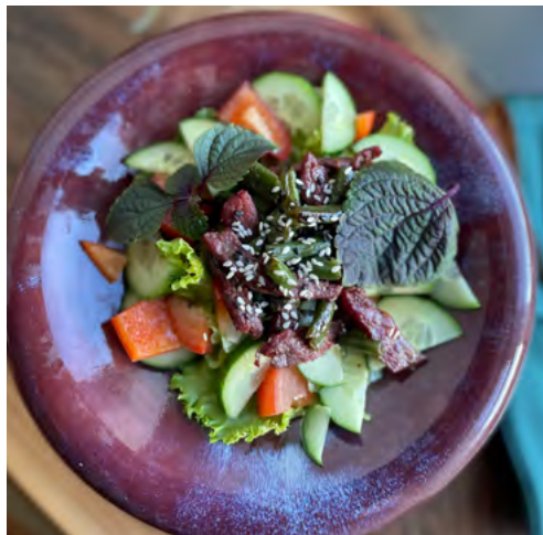
С овощами и телятиной под медово-горчичным соусом 175 гр