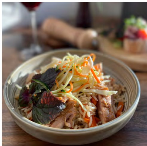
Плов с курицей и овощным салатом 250 гр