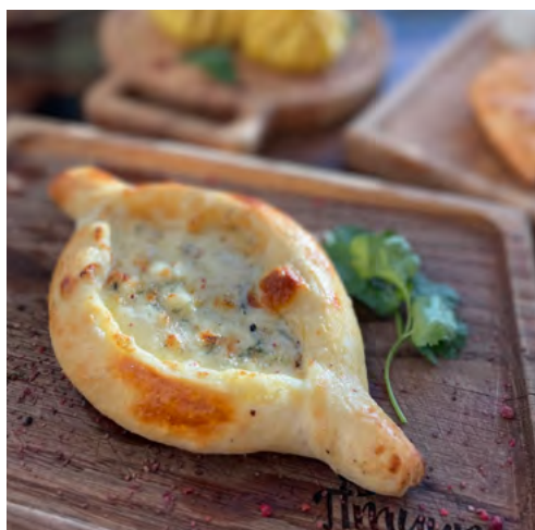
Хачапуре с грушей и дор блю 150 гр