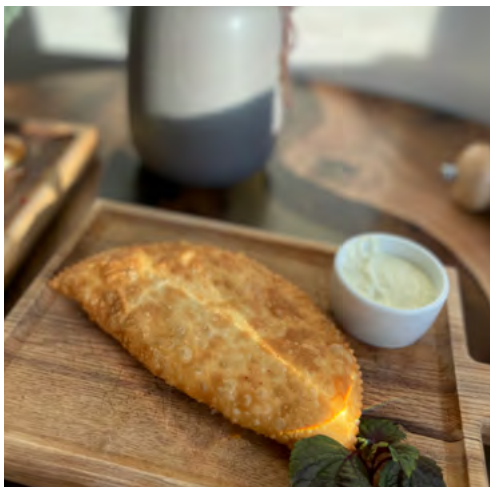
Чебурек с мясным фаршем 140 гр