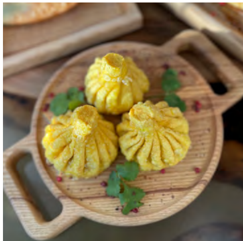
Жареные хинкали с грибным рагу 280 гр