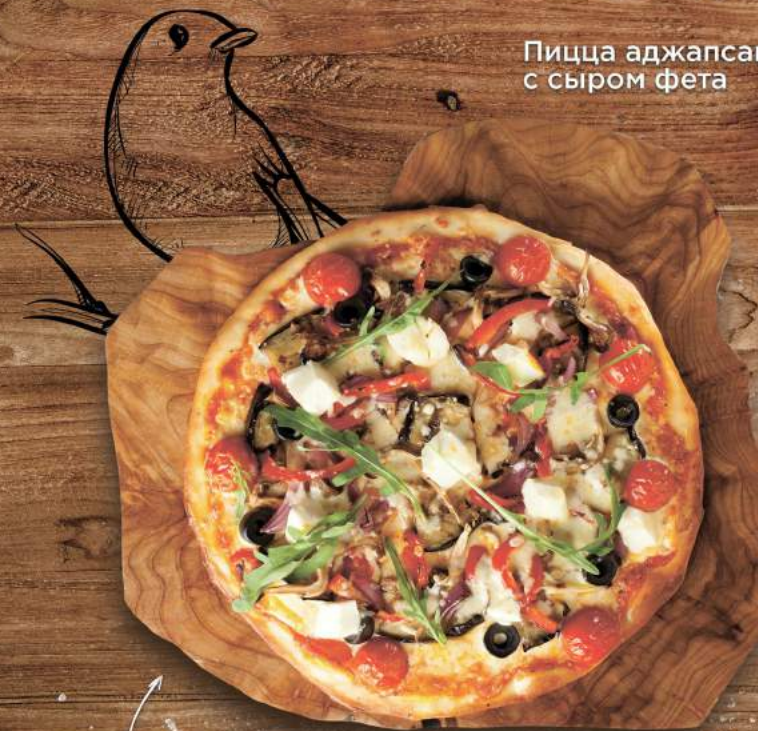
Пицца аджапсандали с сыром фета