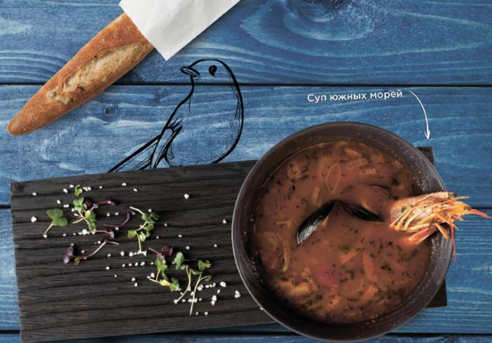
Суп южных морей