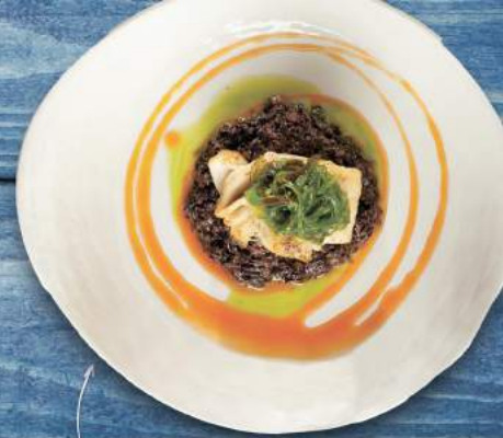
Треска с ризотто с Venera Nero