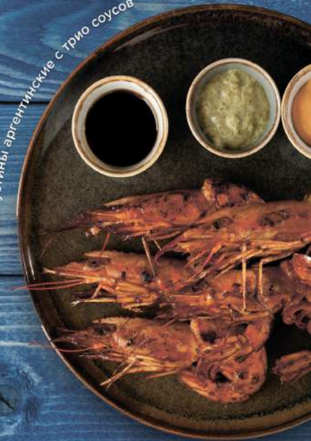
Лангустины аргентинские с трио соусов