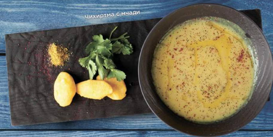
Чихиртма с мчади